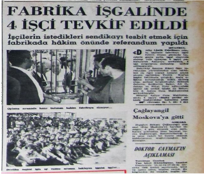
Kaynak: Tercüman, 9 Temmuz 1968.